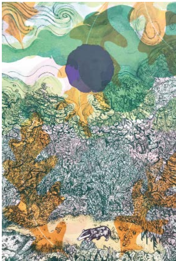
Lamarche & Ovize, Castiglione, le Mirazur, hiver, 2024. Lithographie et bois gravé sur vélin de Rives 270g. 40 ex. 90 x 63 cm

Ainsi, à travers leurs œuvres foisonnantes, le duo réfléchit à la manière de traverser notre époque avec respect et poésie.