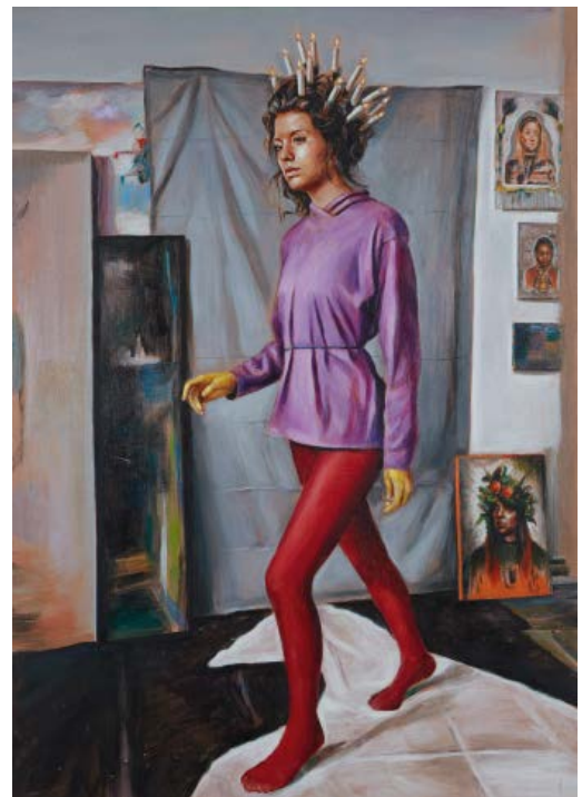
Florence Obrecht, Emilie (d'après "Deux femmes" attribué à Léonor Fini), 2022, Huile sur bois, 70 x 50 cm. © Adagp Paris 2024 Courtesy de la Galerie Valérie Delaunay, Paris, Photographie Fabrice Robin

Sur réservation : robin.oudot@ville-cannes.fr