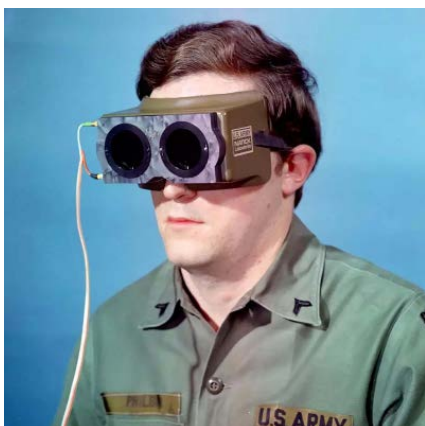
Équipement, lunettes de protection, flash aveuglant, 1974.