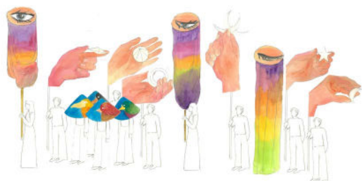
Croquis pour une parade intitulée « Dans la penderie du ciel bleu »