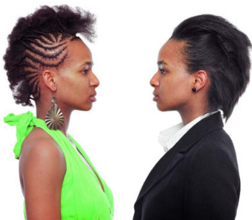
Bayeté Ross Smith, Mirrors Study 3: Rixy, 2010, Digigraphie sur Hahnemühle, © Photo Rag Baryta