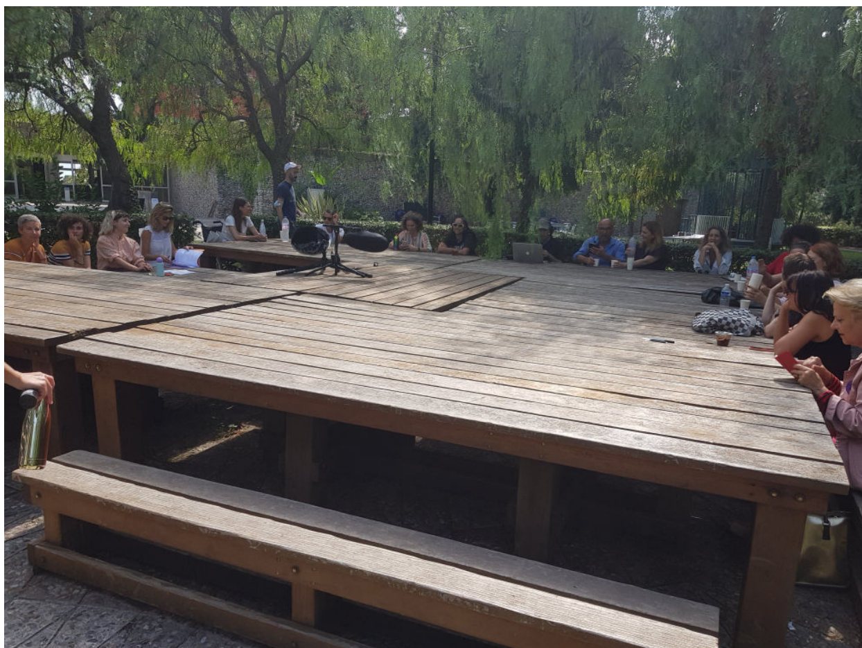
Annonce des résultats et assemblée plénière

6 La proposition #1 de l'ambassade des militant.e.s (28 points) : allouer un pourcentage du budget de BOTOX(S) vers les groupes et actions militantes, non pas pour créer des programmes mais mettre en place des plans d'actions . Consulter et rémunérer des délégué.e.s sur les projets qui les concernent (rien sur nous, sans nous).