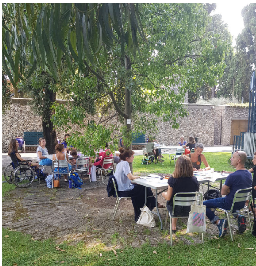
Réunion des ambassades

Les participant.e.s, au-delà de la question de la rémunération et de ses niveaux, ont rappelé la nécessité de mettre en œuvre, à l'instar de la Belgique, du Canada et de bien d'autres pays, un véritable statut, assurant couverture sociale et minimas. L'extension du régime de l'intermittence a été demandée.