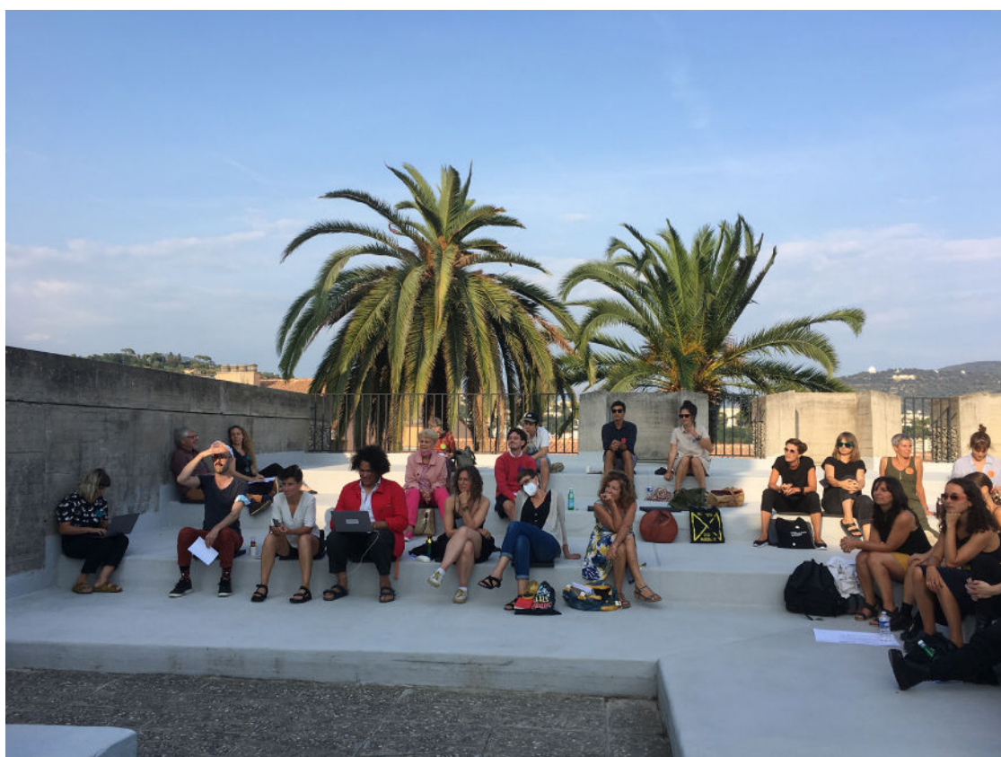
Assemblée plénière dans l'amphithéâtre extérieur

Pour un retour détaillé sur le programme et le déroulé des journées et propositions, cf p.6.