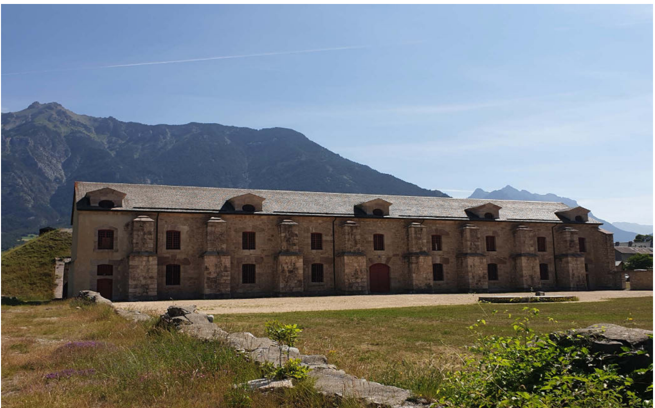
Arsenal de Mont-Dauphin

Tous les événements du festival sont gratuits.