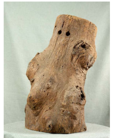
Ruche-tronc, collections départementales du musée de Salagon, Apian 2024

Elle explore les relations millénaires entre les humains et les abeilles, entre ruches du futur et vestiges du passé.