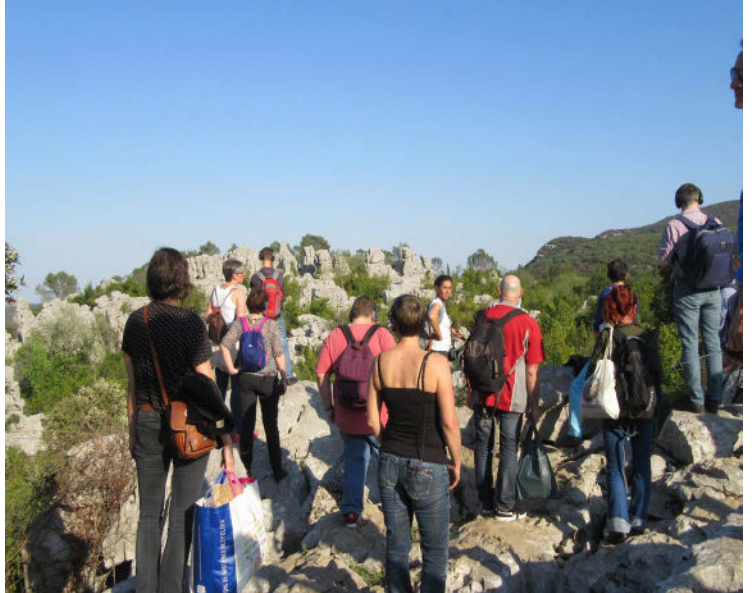
Parcours sonore © Floriane Pochon

Grâce à ses recherches sur le territoire et à sa rencontre avec les habitants et quelques acteurs locaux (Parc naturel régional du Queyras, Centre des Monuments Nationaux), l'artiste nous embarque dans une immersion sonore au coeur de l'imaginaire de la Place forte.