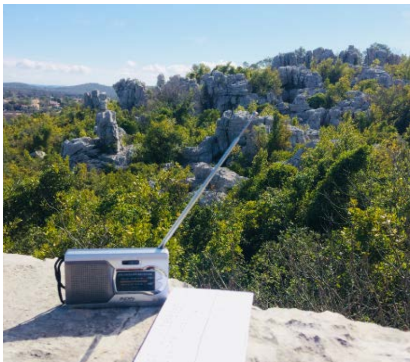
Immersion sonore