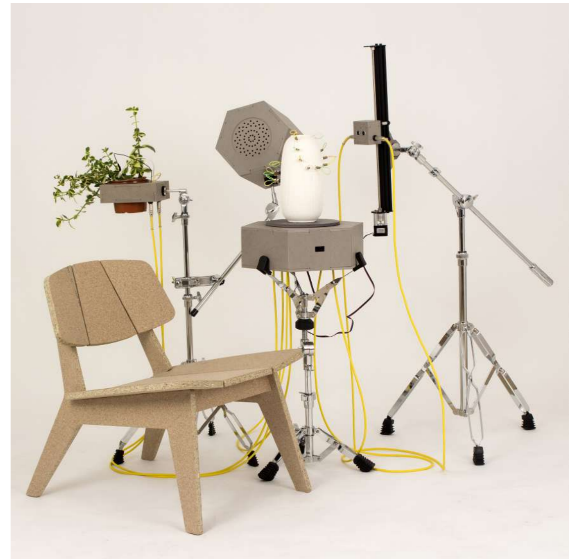
© Mathieu Schmitt, songs without word, 2022