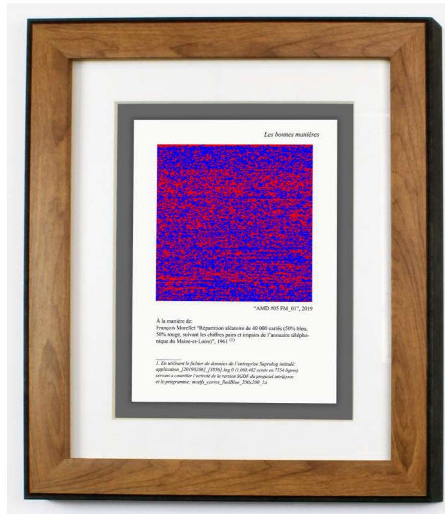
© Mathieu Schmitt - Les bonnes manières - François Morellet 2019 Impression numérique du résultat de l'algorithme dédié, 35x29 cm encadré