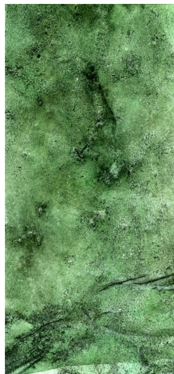
Alexandre Capan Faux Semblants - 2013 et 2021 Tirage numérique direct sur dibond Env. 50 x 30 cm et Env. 110 x 80 cm

FUGUES Alexandre Capan CIAC de Carros Exposition du 30 octobre 2021 au 16 janvier 2022